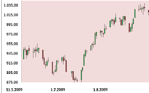
S&P 500 3M