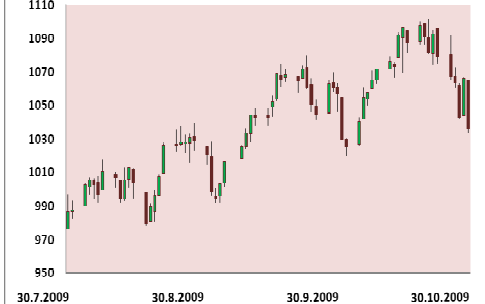
S&P 500 3M