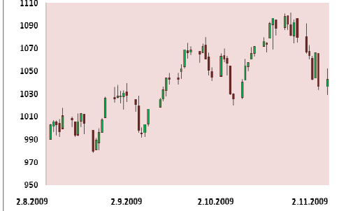
S&P 500 3M