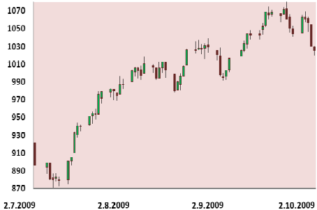
S&P 500 3M