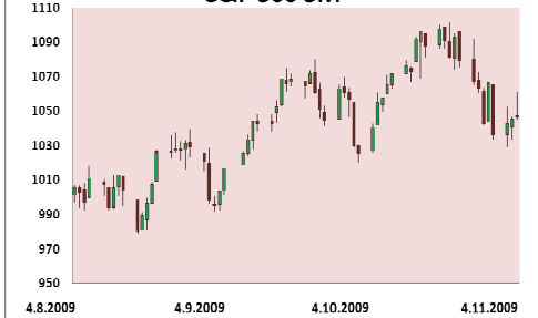
S&P 500 3M