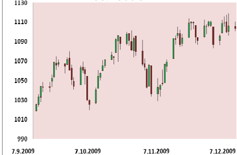
S&P 500 3M