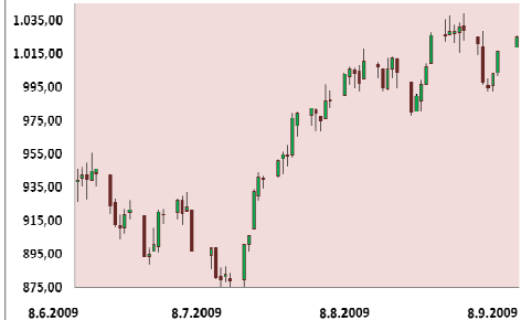
S&P 500 3M