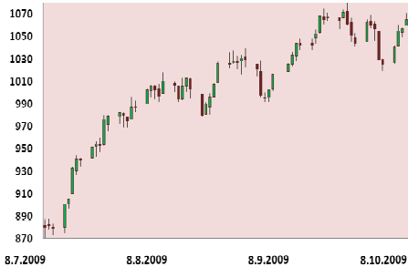
S&P 500 3M