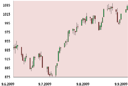
S&P 500 3M