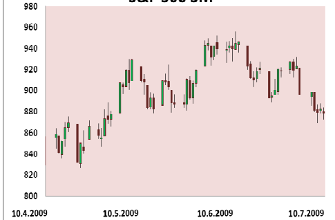
S&P 500 3M