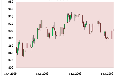
S&P 500 3M