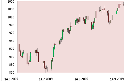
S&P 500 3M