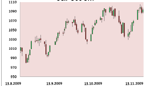
S&P 500 3M