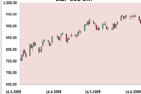
S&P 500 3M