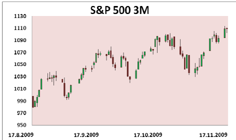
S&P 500 3M