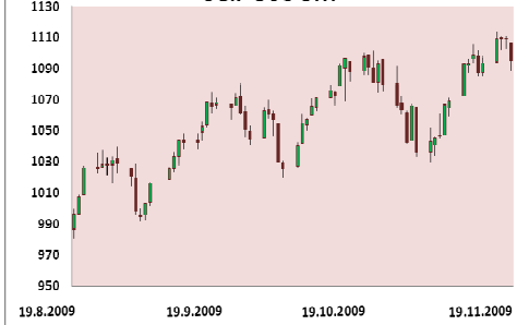
S&P 500 3M