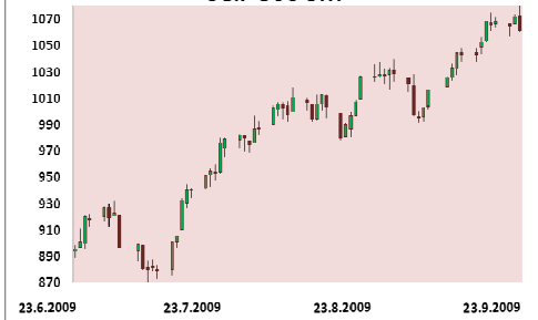
S&P 500 3M