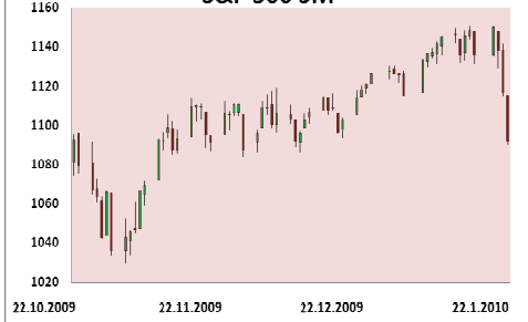
S&P 500 3M