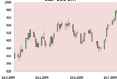
S&P 500 3M