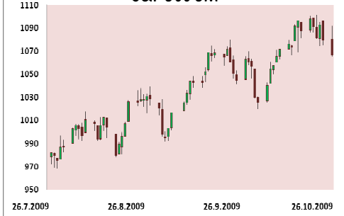
S&P 500 3M